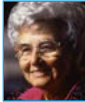
끼아라 루빅, 나폴리, 1996년 5월 3일, 나폴리 공동체와의 만남

예를 들면, 주는 것인데, 갖기만을 원하는 다른이들 앞에서 너는 주는 문화를 증거합니다. 너는 순수한 젠으로 순결을 증거합니다. 반면 너도 알다시피 다른이들은 쾌락과 모든 좋지 않을 쫓고 있습니다. 너는 용서가 무엇인지 압니다. 예를 들어 누군가 너에게 상처를 주