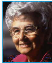
Chiara Lubich, Napulj, 3. svibnja 1996. Zajednici u Napulju

Na primjer: ti živiš davanje, kulturu davanja, pred onima koji žive kulturu posjedovanja. Ti svjedočiš čistoću, jer si čisti Gen, dok drugi ... ti znaš kako je s edonismo i drugim ružnim stvarima. Ti praštaš: na primjer ako te netko uvrijedi, ti oprostiš, dok se drugi osvećuju. Ti ljubiš svoje roditelje, dok se obično generacije sukobljavaju. Ti ljubiš