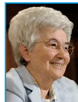
Chiara Lubich, Kongres Gen 3, siječnja Blaženstva 10. lipnja 1974

Ako mlada osoba nema iskreno srce, ako ne želi prvo ostvariti Božje naume umjesto svojih, ako tisuće zloća pune njegovo srce, jasno jedan nemože vidjeti Boga.