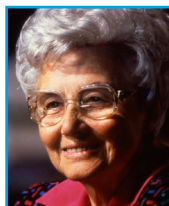
Chiara Lubich, Neapelj, 3. maja 1996, neapeljski skupnosti

Ti znaš odpustiti; če te kdo na primer žali, mu odpustiš; drugi pa se maščujejo.