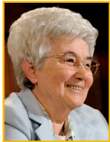
Chiara Lubich, Rocca di papa, 20 Juni 1975, Kongamano la gen 3, Heri

D unia inasema heri matajiri na Yesu anasema heri masikini, tena kwa matajiri anasema: «ole wenu, kwa sababu mmeshapata thawabu yenu». Ni kweli, kama kijana mmoja mifuko yake imejaa pesa, kila wakati atafikiri juu ya nini anunue, afanyeje awe na pesa nyingi zaidi ya wenzie na atataka wenzie wamani. Majivuno yanaongezeka na moyo wake hauwi makini kwa sauti ya Mungu na karibu haitawezekana yasimpate yale ya kijana tajiri wa kwenye Injili ambaye pamoja na kuwa aliitwa na Yesu mwenyewe, hakufaulu kumfuata kwa sababu aling'ang'ania mno mali zake.