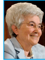
Chiara Lubich, Congrès Gen 3, Les béatitudes, 20 juin 1975

S i un jeune n'a pas un cœur sincère, s'il ne désire pas suivre les intérêts de Dieu plutôt que les siens, si mille méchancetés occupent son cœur, il est évident qu'il ne peut voir Dieu.