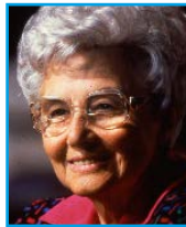
Chiara Lubich, Nápoles, 3 de mayo de 1996, a la comunidad de Nápoles

Por ejemplo: tú vives el dar; vives la cultura del dar, en contraposición a todos los que sólo quieren tener. Tú vives la pureza, eres un gen puro; mientras que los demás, sabes bien que viven en el hedonismo, con tantas cosas feas. Tú perdonas. Por ejemplo, si alguien te ofende, perdona; mientras que los demás se vengan.